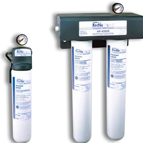
Arctic Pure 10000